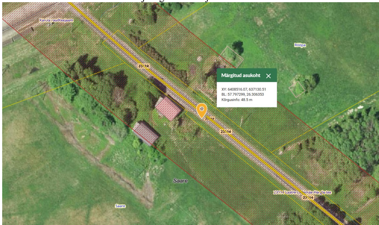
Joonis 1. Ristumiskoha asukoht tähistatud oranži tingmärgiga.